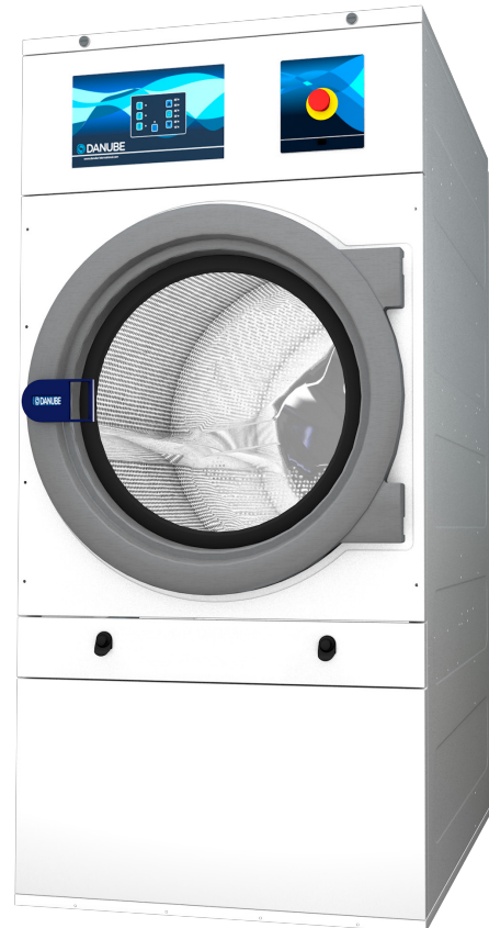
Programmateur EM + nouvel affichage

Panneaux peints blancs Transmission directe par motoréducteur COOL DOWN - anti-froissement en fin de cycle Chauffage électrique ou gaz Homologation CE